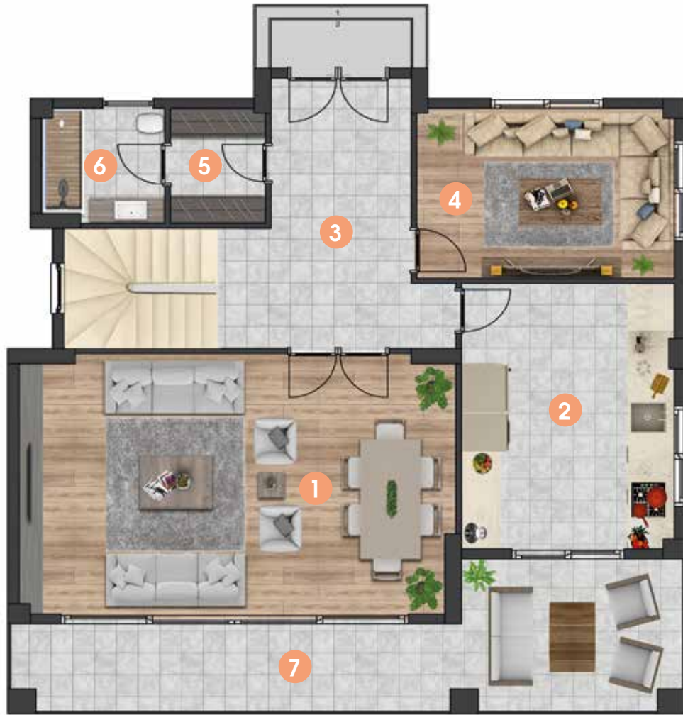
ZEMİN KAT PLANI